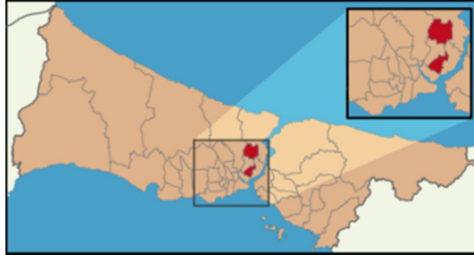
Harita 2 – Şişli İlçesi Konumu

İstanbul'un merkezinde yer alan Şişli güneyinde Beyoğlu, doğusunda Beşiktaş, kuzeyinde ve batısında Kağıthane ilçeleri ile çevrilidir. Şişli çok çeşitlilik gösteren bir bölge olup, her sınıftan ofis binasını, yeni karma projeleri, alışveriş merkezlerini, konut bölgelerini, beş yıldızlı otelleri ve konferans merkezlerini bünyesinde barındırmaktadır. İlçe kuzeyde Mecidiyeköy ve Zincirlikuyu üzerinden Ayazağa'yı da içine alarak Sarıyer'e, kuzeybatıda ise Hürriyet-i Ebediye Tepesi üzerinden Kağıthane'ye kadar geniş bir alana yayılır. Adrese Dayalı Nüfus Kayıt Sistemi verilerine göre ilçenin 2012 yılı nüfusu 318.217 kişidir ve toplam yüzölçümü 30 km 2 olan ilçe idari olarak 28 mahalleden oluşmaktadır.