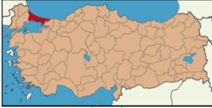
Harita 1 - İstanbul İli Konumu

Ülkenin finans merkezi olan İstanbul'un nüfusu 13 milyonun üzerinde olup, bu rakam artmaya devam etmektedir. Adrese Dayalı nüfus Kayıt Sistemi verilerine göre İstanbul İli'nin 2012 yılı toplam nüfusu 13.854.740 kişi olup ülke nüfusu içerisinde %18'lik orana sahiptir. İkinci en büyük şehir olan Ankara'dan yaklaşık üç kat fazla nüfusa sahip olan şehir, ülkenin kentleşme sürecinin de ana odağı olmuştur. Konut ihtiyacının en belirgin olduğu şehir olan İstanbul yeterli ve kaliteli konut temininde ciddi sorunlar yaşamaktadır. Sonuç olarak, kent dışında devlet ve özel yatırımcılar tarafından yeni toplu konutlar yapılmakta, şehrin Avrupa Yakası'nda gelişme şehir merkezinin batısından bu kent dışı alanlara doğru kaymaktadır.